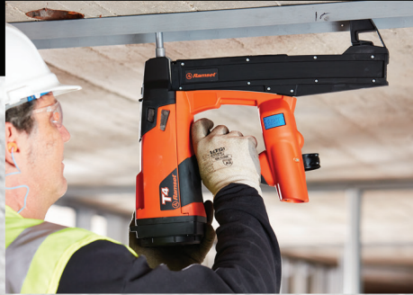
Rail sur béton