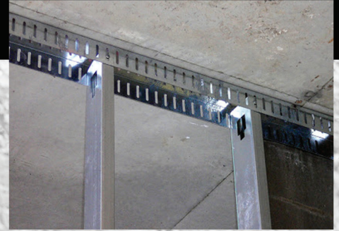
Rail à jambe profonde